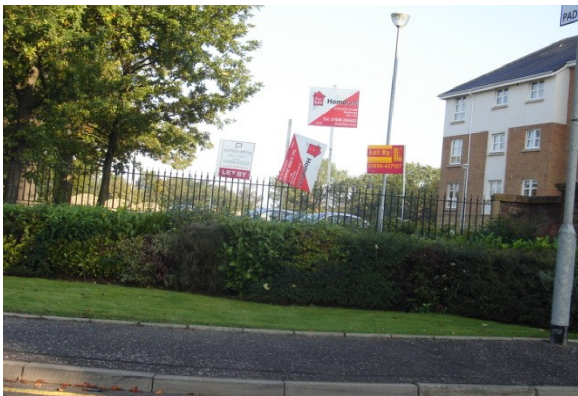
Fot. Tablice informacyjne agencji

Agencje najmu bardzo często reklamują się tablicami informacyjnymi umieszczanymi przed lokalem, który posiadają do wynajęcia.