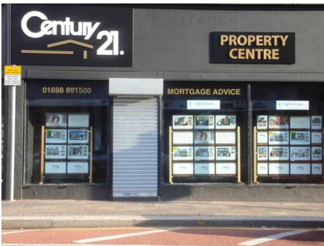
Fot. Agencja wynajmu mieszkań

Sposób wynajęcia mieszkania za pośrednictwem agencji ogranicza się do następujących czynności, którym zostajemy poddani: